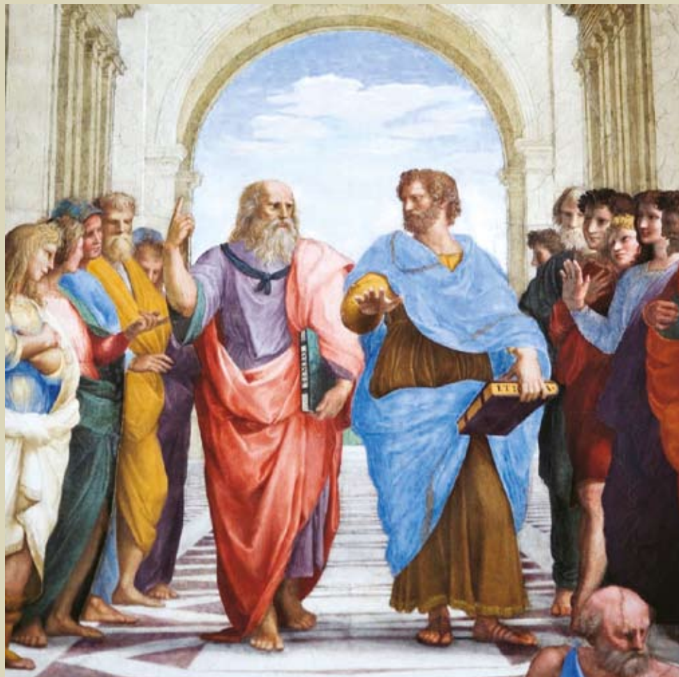
Scuola di Atene - Affresco di Raffaello Sanzio

Educazione e Formazione Permanente Fondata nel 1996 con il Lions Club Cassina de' Pecchi - Naviglio Martesana